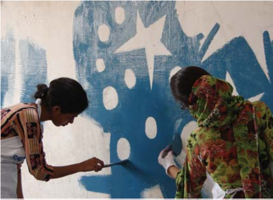
شاگرد چائلڊ ڊولپمينٽ سينٽر جي ديوارن تي رنگ روپ ڪري رهيا آهن.

مسئلن بابت ويهڪون ڪريان. اهو ئي ڪم آهي جنهن ۾ مون کي دلچسپي آهي.