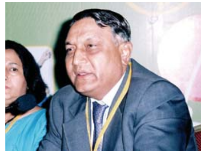
سنڌ جو اڳوڻو گورنر ليفٽيننٽ جنرل (رتائرڊ) معين الدين حيدر صاحب