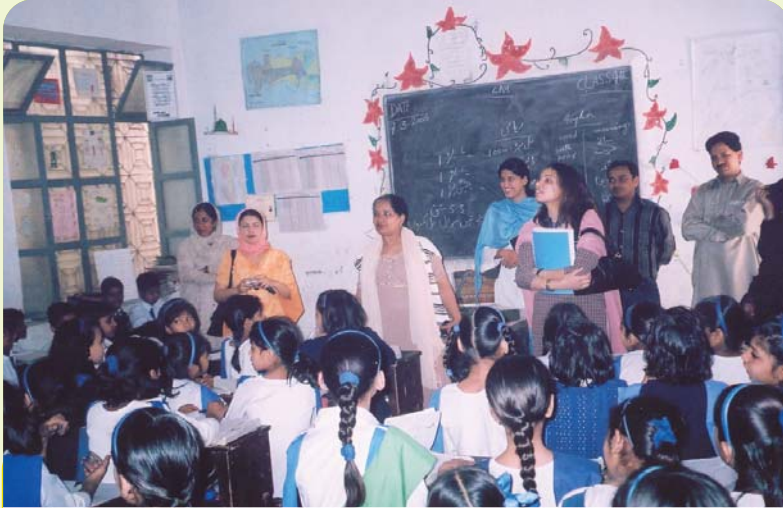
ايڊاپٽ - اي - اسڪول پروگرام جا ميمبر پنهنجي لاهور واري دوري دوران هڪ اسڪول جو معائنو ڪندي

ايڊاپٽ-اي-اسڪول پروگرام جي ٽيم طرفان پيش ورائڻ تي جي حڪومت عملي طور 5- مارچ، 2006ع کان 11- مارچ، 2006ع تائين هڪ مطالعاتي دورو ڪيو ويو. انهيءَ مطالعاتي دوري ۾ ادارہ تعليم و آگاهي لاهور ۽ پاڪستان سينٽر آف فيلڊ ٽراپي، اسلام آباد جو دورو به شامل هو، جتي پنجاب جي ايڊاپٽ اي اسڪول پروگرام جو مطالعو ڪرڻو هو. پروگرام جي ٽيم ميمبرن ۾ اتان جي تعليم و تربيت جو جائزو وٺڻ ۽ انهن کي صحيح نموني سمجھڻ ۽ انهن کي پنهنجي علائقائي ڍانچي ۽ ضرورتن مطابق نافذ ڪرڻ جي حوالي سان گهربل مڪمل صلاحيت موجود هئي. انهيءَ دوري جي نتيجي ۾ سنڌ ايجوڪيشن فائونڊيشن کي سنڌ ۾ پنهنجي ايڊاپٽ-اي-اسڪول پروگرام کي زور وٺرائڻ خاطر ٻين تنظيمين سان ادارتي تعلقات قائم ٿيا.