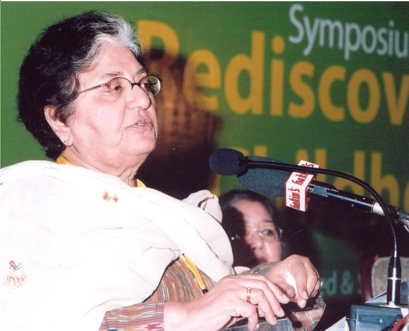
ٻالڪيٽ جي ڳولا بابت مذاڪري ۾ شرڪت ڪندڙن کي وزير تعليم حڪومت سنڌ ڊاڪٽر حميده ڪهڙو خطاب ڪري رهي آهي