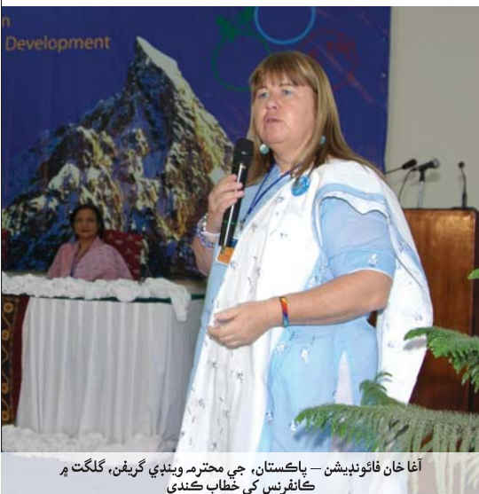
آغا خان فائونڊيشن — پاڪستان، جي محترم وينڊي گريشن، گلگت ۾ ڪانفرنس کي خطاب ڪندي