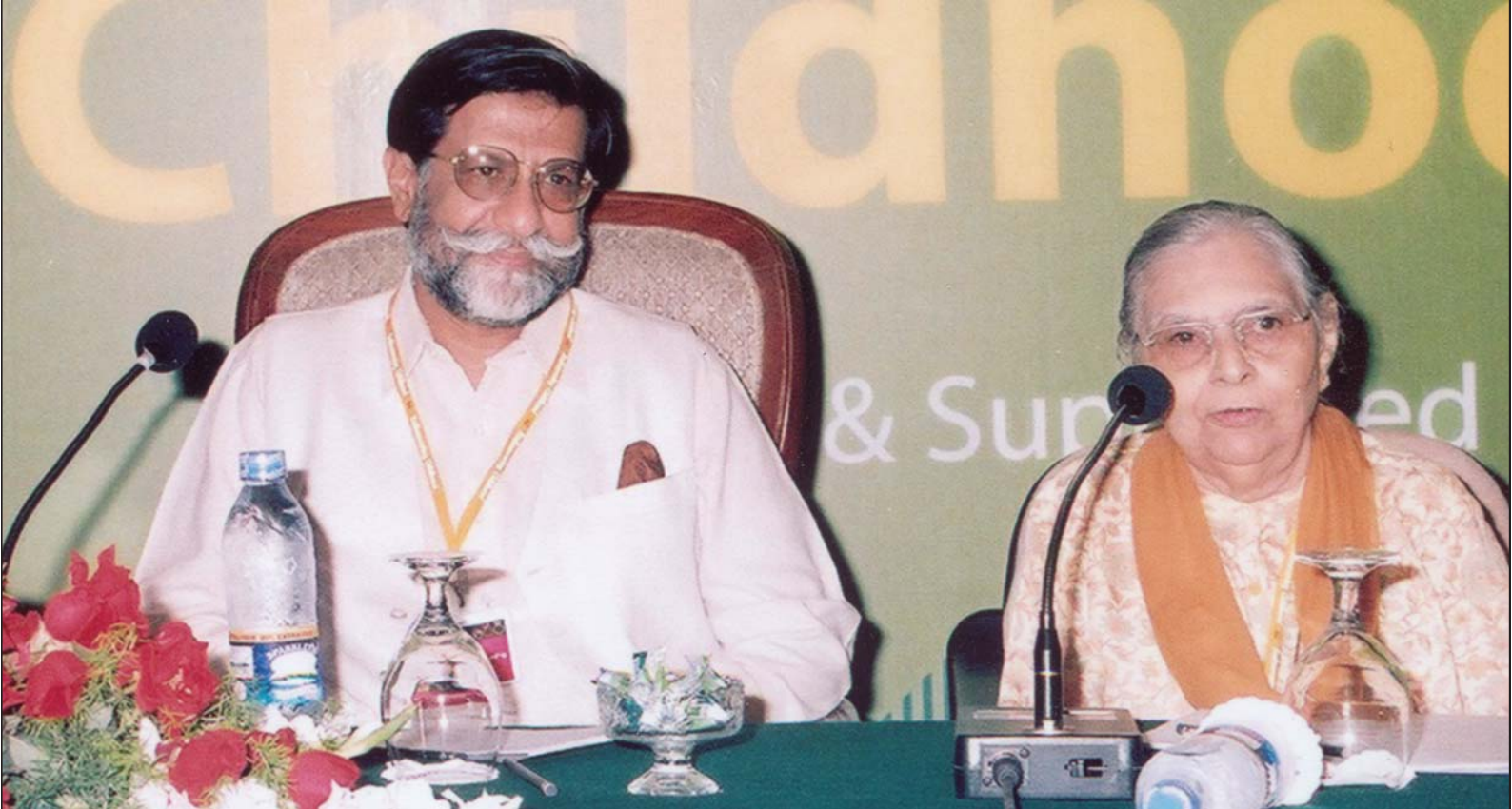
پاڪستان جي سينيٽ جو چيئرمين محمد ميان سومرو ۽ پروفيسر انيٽا غلام علي (ستاره امتياز) ’بالڪيٽ جي ڳولا‘ بابت مذاڪري ۾ ويٺل